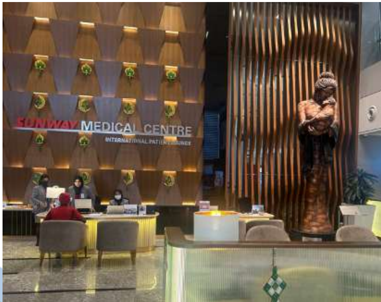
ホテル仕様のSUNWAY MEDICAL CENTER