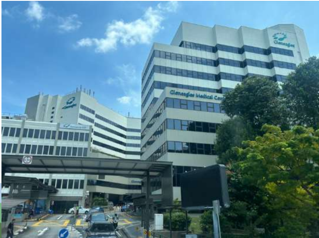
Gleneagles Hospital Singapore

グレニーグルス病院は、シンガポールおよび地域全体で二次・三次医療を必要とする患者のニーズに応えるため、幅広い臨床専門分野を提供。この病院内にある日系クリニック、日本メディカルケアシンガポールの佐藤医師にインタビュー。