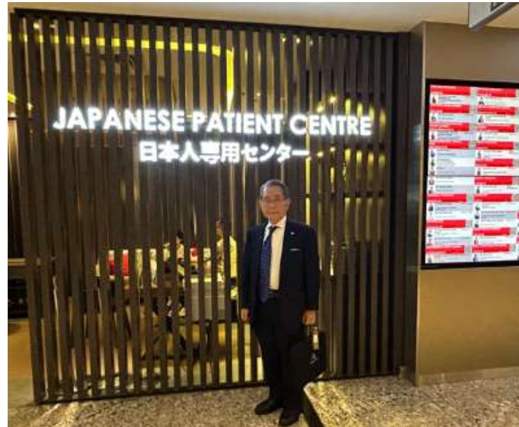
日本人専用センター