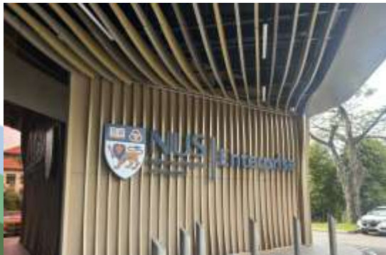
NUS Enterprise entrance