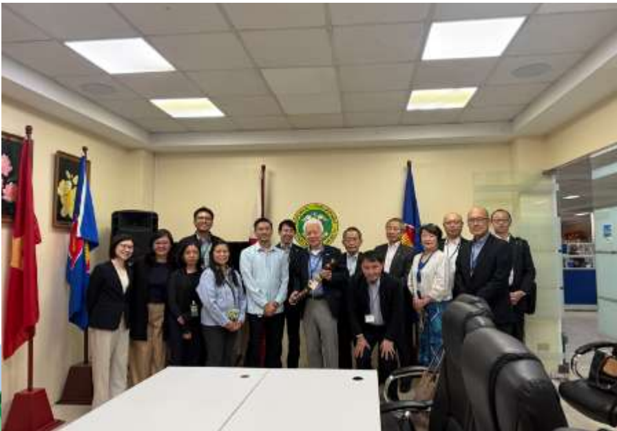
保健省（DOH）にて記念撮影