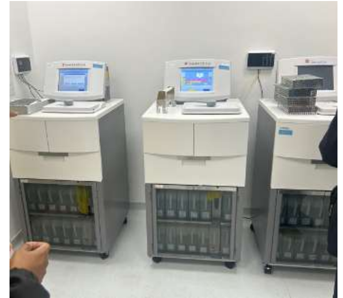
病理関連機器(日本製品)