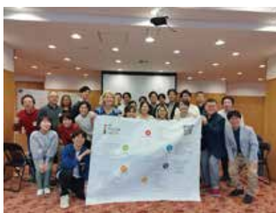
クモの巣を囲んで全員で記念撮影